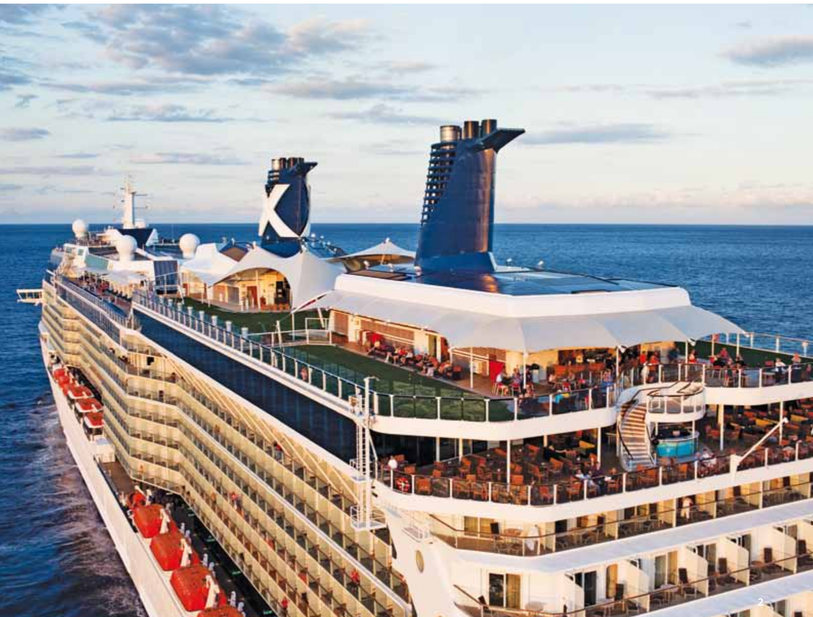
1) Martini Bar & Crush 2) Celebrity Eclipse 3) Balcone privato con vista mare 4) Solarium riservato agli adulti