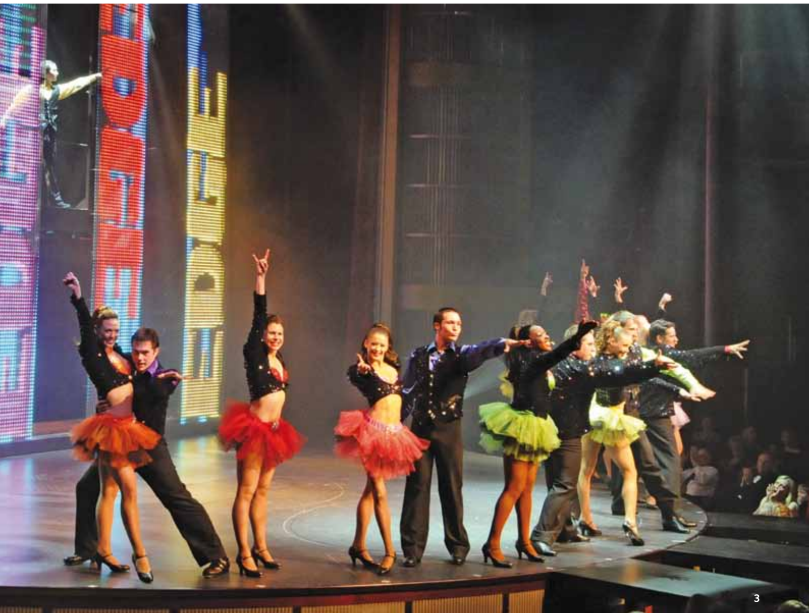
1) Fortunes Casinò 2) Duty-free shopping 3) Animazione di altissimo livello 4) Maestri Sommelier 5) Ballando al Quasar