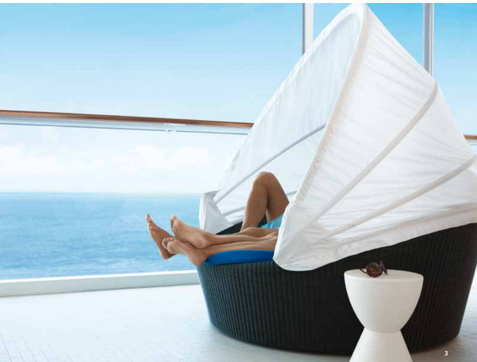
1) Pic-nic sul Lawn Club 2) Rendezvous Lounge 3) Solarium 4) Ristorante Moonlight Sonata 5) Cena al ristorante Blu