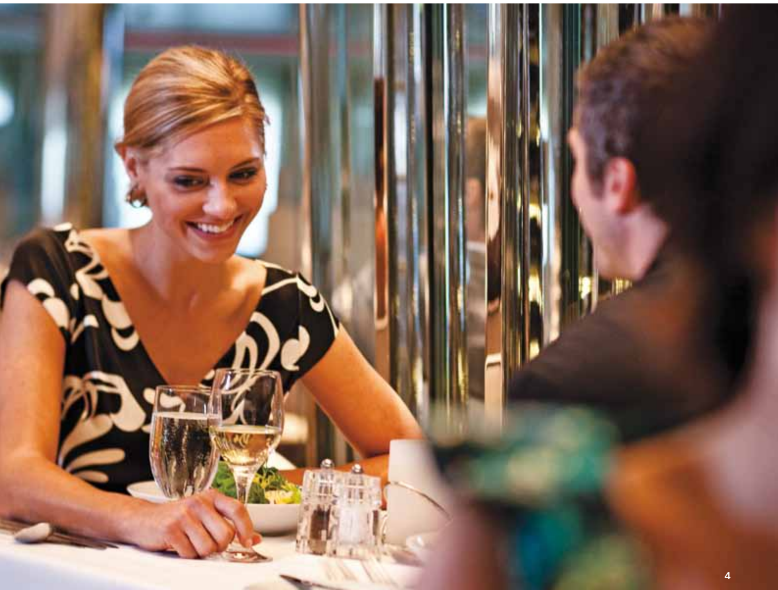
1) L'estetica sopraffina dei piatti al Qsine 2) Il menù interattivo su iPad® 3) Il ristorante Qsine 4-5) Una cena suggestiva nell'incantevole ristorante Tihany Wine Tower caratterizzato dalla torre alta due piani 6) La Sacher Torte